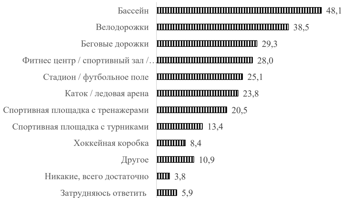
Рис. 2. Оценка востребованности инфраструктурных объектов (ответы экспертов на вопрос «На Ваш взгляд, какие спортивные сооружения и площадки для занятий физкультурой и спортом жителей желательно ввести в строй в ближайшие год-два в Вашем городе (населенном пункте)?», %

В целом результаты опроса специалистов, отвечающих за физкультурно-спортивную работу в муниципальных образованиях, позволяют сделать вывод о положительных тенденциях в развитии спортивной инфраструктуры в Российской Федерации, способствующих увеличению ее доступности для населения. Вместе с тем все больше актуализируется, по мнению органов местной власти, создание новых крупных спортивных объектов (бассейнов, дворцов спорта и пр.).